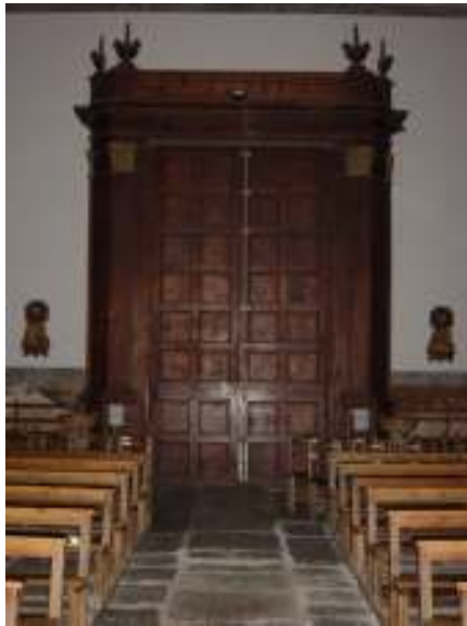
El cancell vist des de dins de l'església