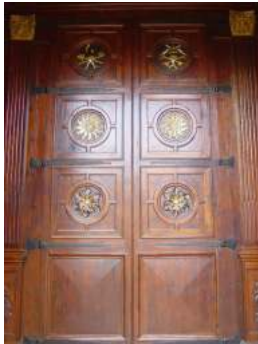
Porta central de doble full que dóna accés a la nau principal de l'església.